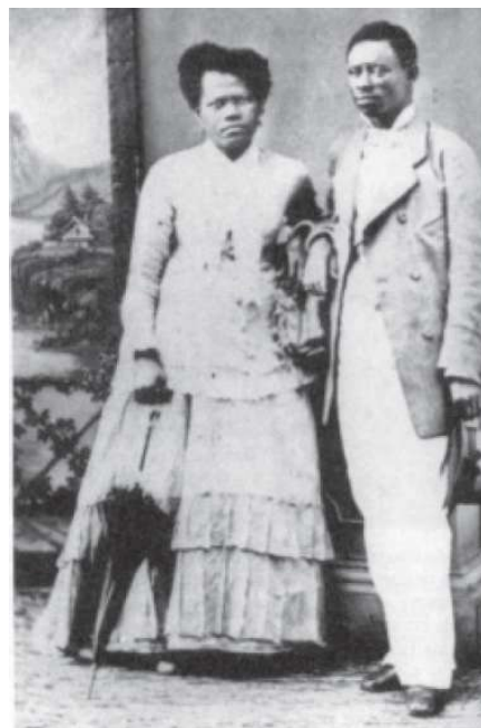
Foto de Militão, São Paulo, 1879. ALENCASTRO, L. F. (org). História da vida privada no Brasil. Império: a corte e a modernidade nacional. São Paulo: Cia. das Letras, 1997.

Que aspecto histórico da escravidão no Brasil do séc. XIX pode ser identificado a partir da análise do vestuário do casal retratado acima?